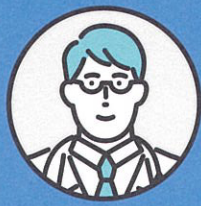
プテロオンライン クリニック